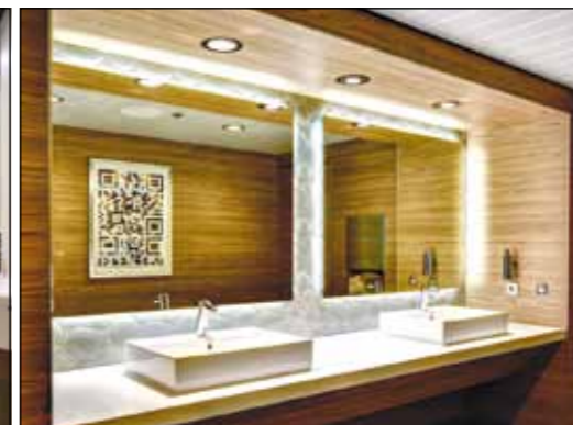
Brausethermostate in den Duschen sorgen in den Bädern der Kabinen für den effizienten Umgang mit dem Wasser. Das gilt auch für die öffentlichen Sanitäranlagen, wo Elektromischer mit Sensortechnologie installiert wurden.

Soweit die touristische Perspektive. Auf der anderen Seite sind solche Kreuzfahrt-Riesen gigantische Baustellen, die für die Ausrüster nicht nur eine logistische Herausforderung darstellen, sondern auch eine technische. Denn ein solches mobiles Hochhaus hat seine eigenen bautechnischen Gesetzmäßigkeiten. Hinzu kommen dann noch die repräsentativen Ansprüche. So läutet die geschätzte 970 Millionen US-Dollar teure „Quantum of the Seas“ auch in den Kabinen ein neues Kreuzfahrt-Zeitalter ein. Ihre Einrichtung und das großzügige Platzangebot erinnern eher an gehobene Hotelzimmer als an Schiffskabinen.