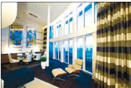
Wohnen und Schlafen mit Meerblick: Blick in eine der Außenkabinen. Wer sich stattdessen mit einer Innenkabine begnügen muss, bekommt zumindest ein „virtuelles“ Fenster.