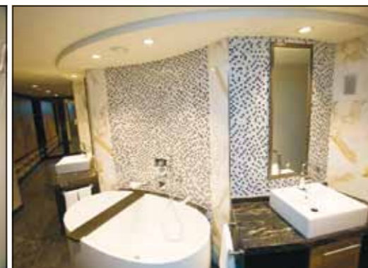
Das besondere Flair, das die schwimmenden Hotelzimmer ausstrahlen, setzt sich bis in die Bäder fort. Eine Kombination aus Mosaikfliesen und Marmor in verschiedenen Farben geben ihnen eine vornehme und zurückhaltende Ausstrahlung.