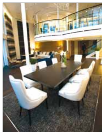
Wer unterwegs ein wenig mehr Platz zum Leben auf See benötigt, bucht eine der „Royal Loft Suiten“: Luxus pur über zwei Decks und einen Whirlpool auf dem Balkon (links und unten, Fotos: Royal Caribbean International).

Abends und nachts vertreibt dann ein hochkarätiges Show- und Musik-Programm die letzte Langeweile. So etwa in der dreigeschossigen Veranstaltungsarena „Two70“, wo Fenster und Wände bei Dunkelheit zu digitalen Projektionsflächen werden und Roboterarme LED-Flatscreens im Takt zur Musik bewegen. Für Roboter-Fans gibt es auch noch ein weiteres Highlight: In der Bionic Bar mixen ihnen maschinelle Barkeeper eine große Auswahl an Cocktails mit großer Präzision und vermutlich auch vollkommen unfallfrei.