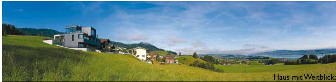
Haus mit Weitblick: