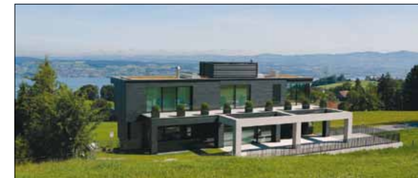
Die Gebäudeansicht von der Bergseite: Die Kühe grasen bis kurz vor der Terrasse.

Das Haus mit Weitblick oberhalb des Zürichsees: Die Architekten: Simmengroup Holding AG ( www.simmengroup.ch/de/ ); der Fassadenbauer: Salm Fassadenbau AG ( www.fassadenbau-salm.ch/ ); die Fassadenverkleidung aus Schiefer „Intersin“: Rathscheck Schiefer und Dach-Systeme (56707 Mayen-Katzenberg, Tel.: 02651-955-0, www.rathscheck.de/ oder www.schiefer.de/ ).