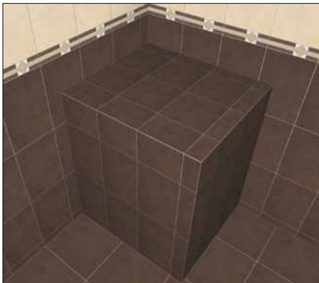
Praktische Funktion für Badplaner: Die automatisch korrekt geplanten Fliesenfugen (links).