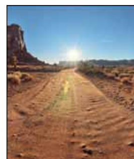
Rechts: Faszinierende Außenwelt aus der HDR-Welt per Icon-Klick importieren: So kommt der Blick auf Strand und Horizont sehr realistisch vor das Fenster.