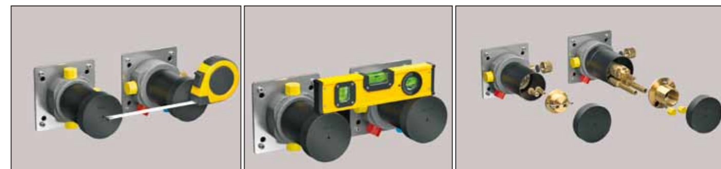
Leicht und sicher lassen sich die Grundkörper justieren. Rechts oben ein Blick in ihr intelligentes Innenleben. Die fast schon geniale Tiefenausgleichsfunktion sorgt dafür, dass immer die gleiche Ausladung der Armaturenelemente vor der Wand gegeben ist (rechts).

Mithilfe eines „Onlineplaners“ mit detaillierter Produktzusammenstellung und -beschreibung können sich Kunden ihr Wunschbad unter www.ixmo.de individuell konfigurieren. Badewanne oder Dusche? Ein oder mehrere Verbraucher? Runde oder eckige Rosette? Es ist eine Vielzahl an Kombinationen der