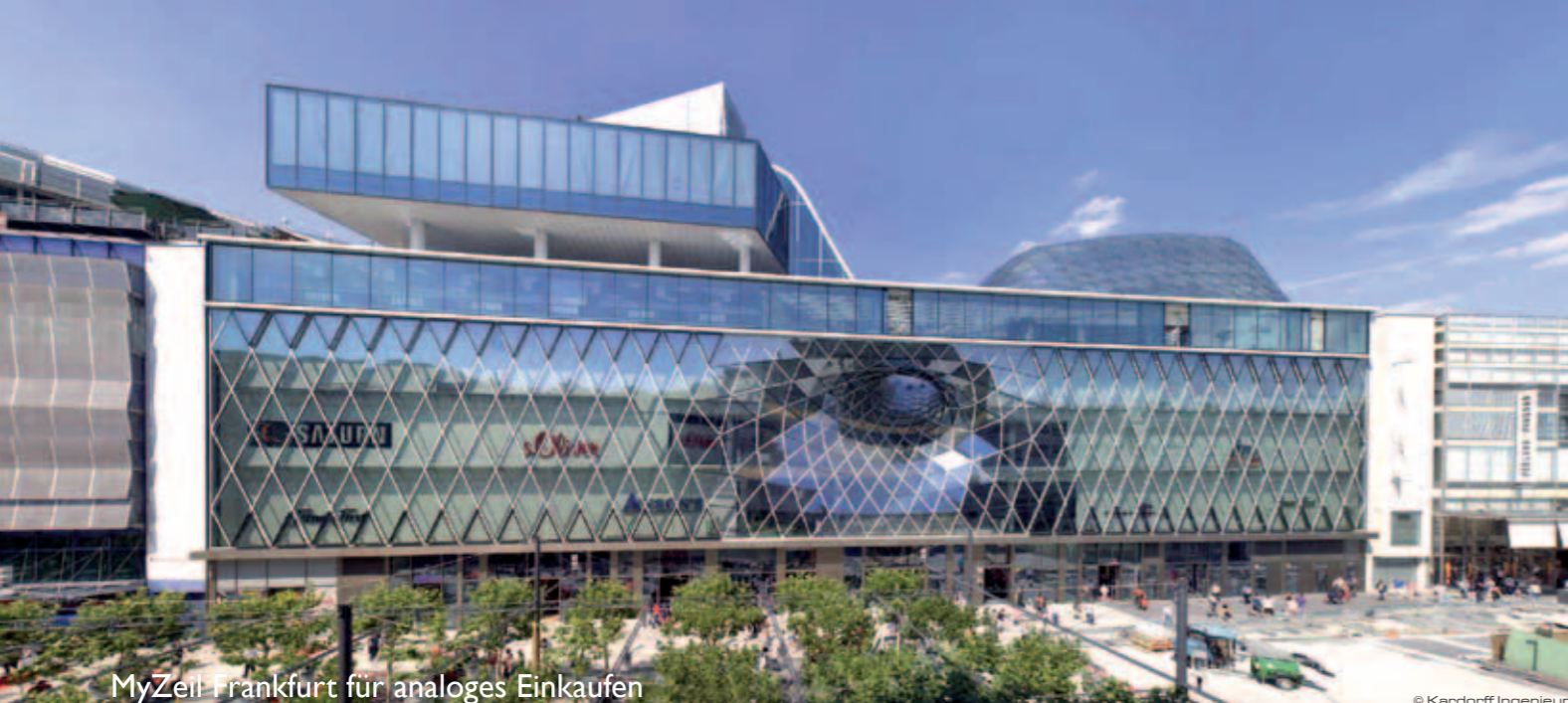
MyZeil Frankfurt für analoges Einkaufen