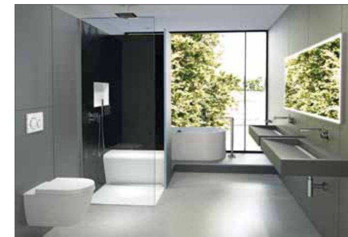
Ein optisches Highlight und gleichzeitig einfach in Montage und Pflege: die stilvollen Oberflächen von „Wedi Top Line“.

Neben den bisher verfügbaren Farben „Pure Weiß“, „Stone Grau“ und „Carbon Schwarz“ können mit „Sahara Beige“ und „Concrete Grau“ noch individuellere Akzente gesetzt und neue Farbkombinationen realisiert werden. Die großformatigen Oberflächen sind fugenfrei, somit leicht zu reinigen und zudem antibakteriell und schimmelresistent, was höchste Hygiene gewährleistet. Die Elemente der „Wedi Top Line“ bestehen aus natürlichen Komponenten und sind hochwertiger Natursteinoptik nachempfunden, womit jedes Stück einzigartig ist. Die Farbe „Pure Weiß“ besticht durch seine homogene Textur.